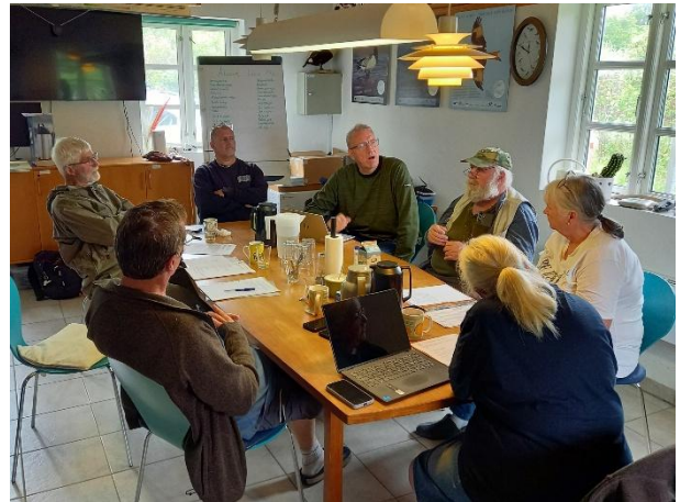
Styregruppen holder møde.

GFU vil tage spørgsmålet om fælles standard og kontrol af målinger op i FSU. GFU vil desuden selv arbejde med sagen.