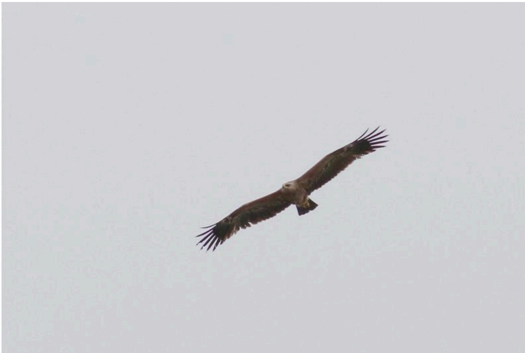
2K Lille Skrigeørn (Lesser spotted eagle, Aquila pomarina). Gedser Odde 09.06.2013

Ifølge Netfugl.dk er maj den måned, hvor der er registreret flest Lille Skrigeørne i Danmark (listen over Lille Skrigeørn, er dog ikke opdateret siden 2013, hvor Lille Skrigeørn udgik af SU-listen). Det kan derfor undre, at Lille Skrigeørn slet ikke er registreret ved Gedser i maj måned, men her spiller geografien en stor rolle, idet Sydfalsters spids kun er ca. tre km bred.