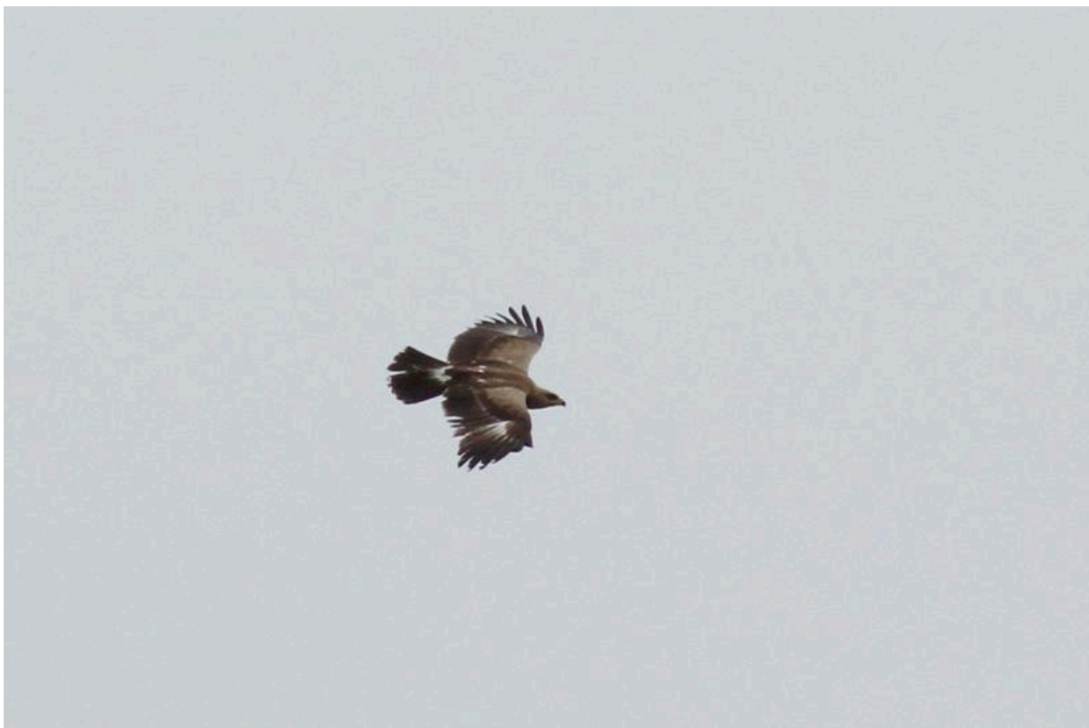
2K Lille Skrigeørn (Lesser spotted eagle, Aquila pomarina). Gedser Odde 09.06.2013

I denne analyse ser vi på forekomsten af Lille Skrigeørn ved Gedser. På trods af, at datamaterialet er begrænset, kommer vi alligevel med et bud på, hvilken periode du skal opsøge Gedser for at opnå de bedste chancer for at se en Lille Skrigeørn.