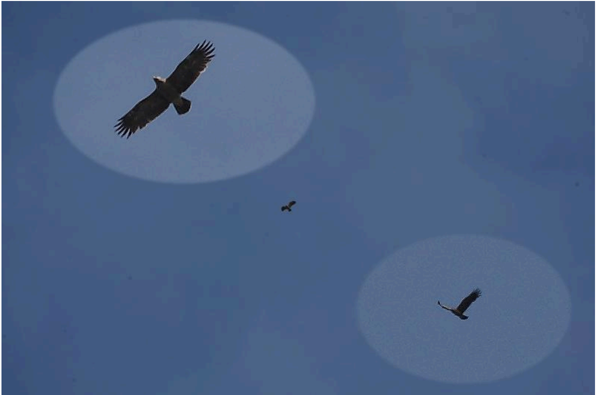
2K eller 3K Lille Skrigeørn (Lesser spotted eagle, Aquila pomarina). Gedser Odde 21.09.2013