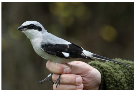
Figur 8. Stor Tornskade 13. november.

Der blev ringmærket 1.683 fugle i løbet af måneden mod 603 sidste år. Fuglekonge toppede med 733 efterfulgt af Rødhals med 227 og Solsort med 208. Af sjældnere arter blev det bl.a. til Stor Tornskade 1, Sibirisk Gransanger 1 og Ringdrossel 1.