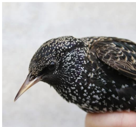
Figur 1. Stær 23. marts.

Blandt småfuglene toppede Jernspurv med 88, Musvit 70 og Blåmejse 61. Forårets eneste Stær blev ringmærket den 23. marts.