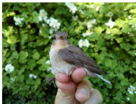
Figur 4. Lille Fluesnapper 18. juni.

Samlet blev der ringmærket 2.484 fugle i løbet af forårssæsonen imod 3.100 i 2020.