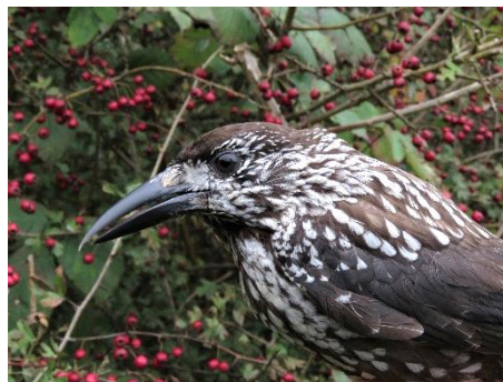
Figur 7. Tyndnæbbet Nøddekrige 19. oktober.

I oktober blev det til 2.843 mærkede fugle mod 4.386 i 2020. I år var Rødhals topscorer med 833 mærkede, Fuglekonge med 596 og Gærdesmutte med 356. Af de mere sjældne kan nævnes Tyknæbbet Nøddekrige 1 og Tyndnæbbet Nøddekrige 1.