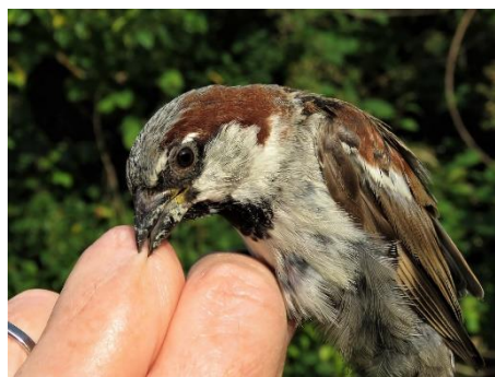
Figur 5. Gråspurv 24. juli.

I september måned fik 2.645 fugle ring på mod 5.863 i 2020. Flest var der af Rødhals med 1.157, men også pæne antal for Gransanger med 477 og Munk med 252. Der blev ikke fanget særligt sjældne arter.