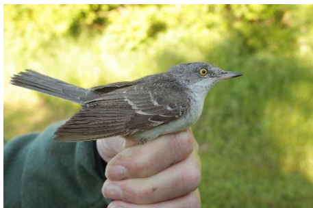
Figur 3. Høgesanger 31. maj.

I april blev der ringmærket 903 fugle, hvilket var omtrent det samme antal som de 1.002 i 2020. Jernspurv toppede med 231 efterfulgt af Rødhals med 183 og Gransanger med 117. Af de sjældnere arter blev der ringmærket 3 Kernebidere og 1 Vende-hals.