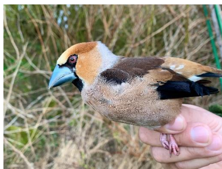
Figur 2. Kernebider 2. april.

I maj måned blev der ringmærket 836 fugle mod 856 i 2020. Flest var der af Gærdesanger med 158, Løvsanger med 114 og Torn-sanger 85. Lidt sjældenheder var der imellem med en ringmærkning af henholdsvis Hvidskægget Sanger 1, Høgesanger 1 og Buskrørsanger 1.